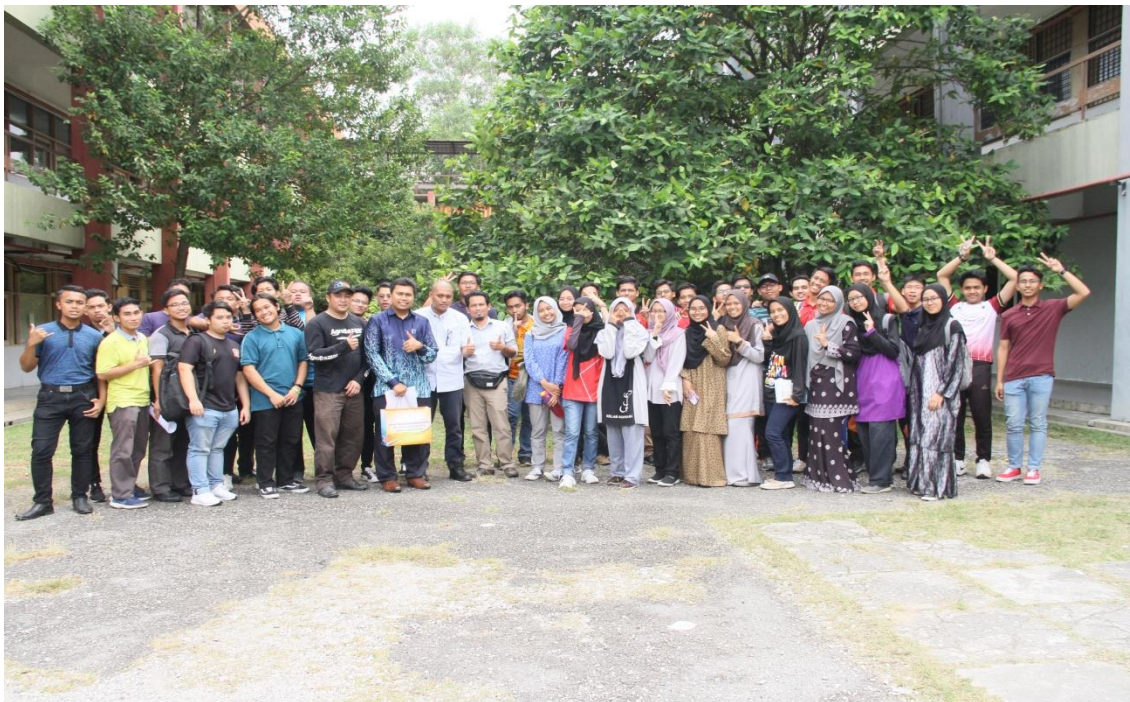
Seramai 50 peserta, 7 pengajar bidang pertanian dan 2 pegawai FAMA telah menjayakan bengkel Agrobazaar Online.