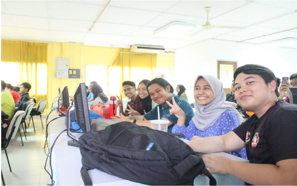
Peserta tampil ceria dan bersemangat ketika menghadiri bengkel Agrobazaar Online