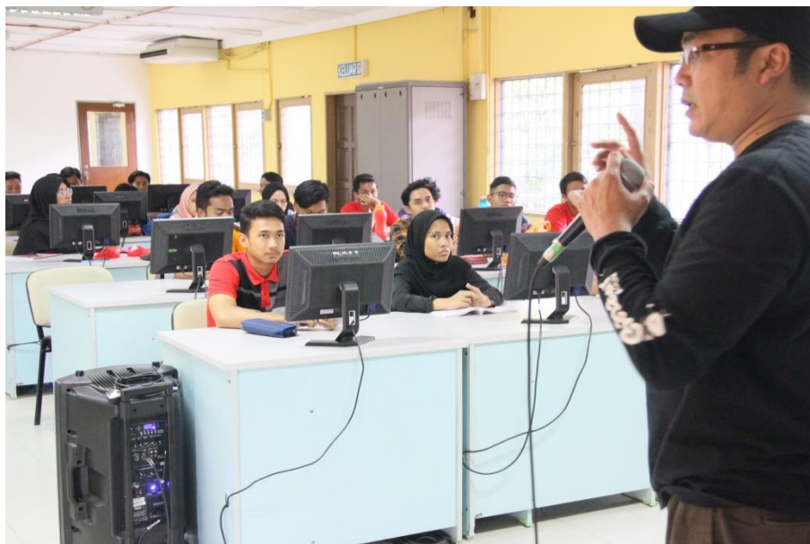
Peserta fokus mendengar penerangan yang diberikan

Seramai 50 peserta dalam kalangan pelajar telah mengikuti bengkel ini dan sebahagian daripada peserta begitu berminat untuk mendaftar diri dalam Agrobazaar Online ini. Ini adalah kerana mahasiswa juga mampu menjana pendapatan sampingan meskipun mereka tidak memiliki modal dan produk fizikal pertanian. Malah peserta yang berminat akan diberi tunjuk ajar daripada mentor yang dilantik oleh FAMA dalam menjalankan aktiviti Agrobazaar Online ini.